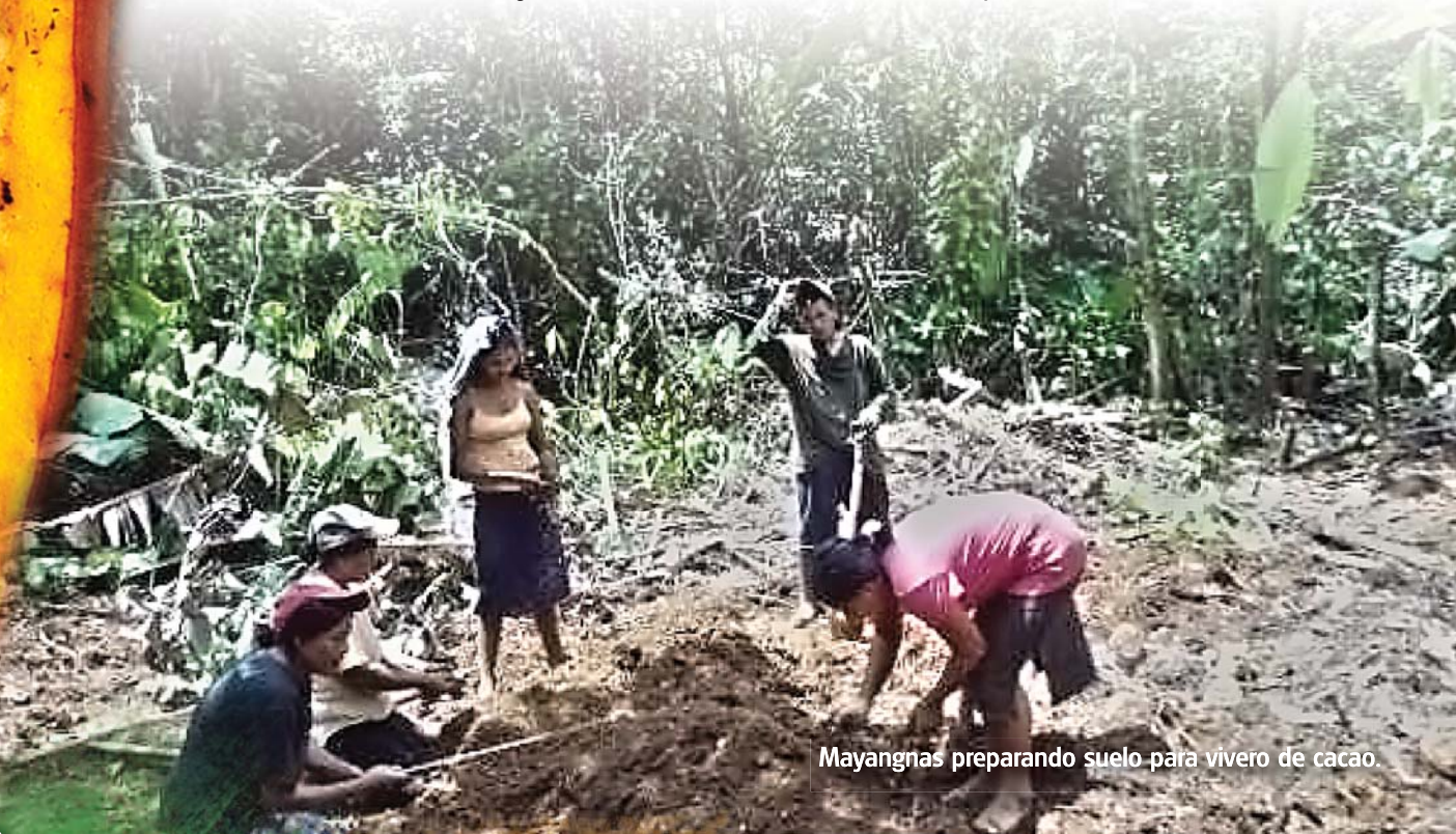
Mayangnas preparando suelo para vivero de cacao.

Indian ai iwankaba ai tasbaya, baku sin ai dusa naniba wal ai pawanka brisa kan bahaba ai