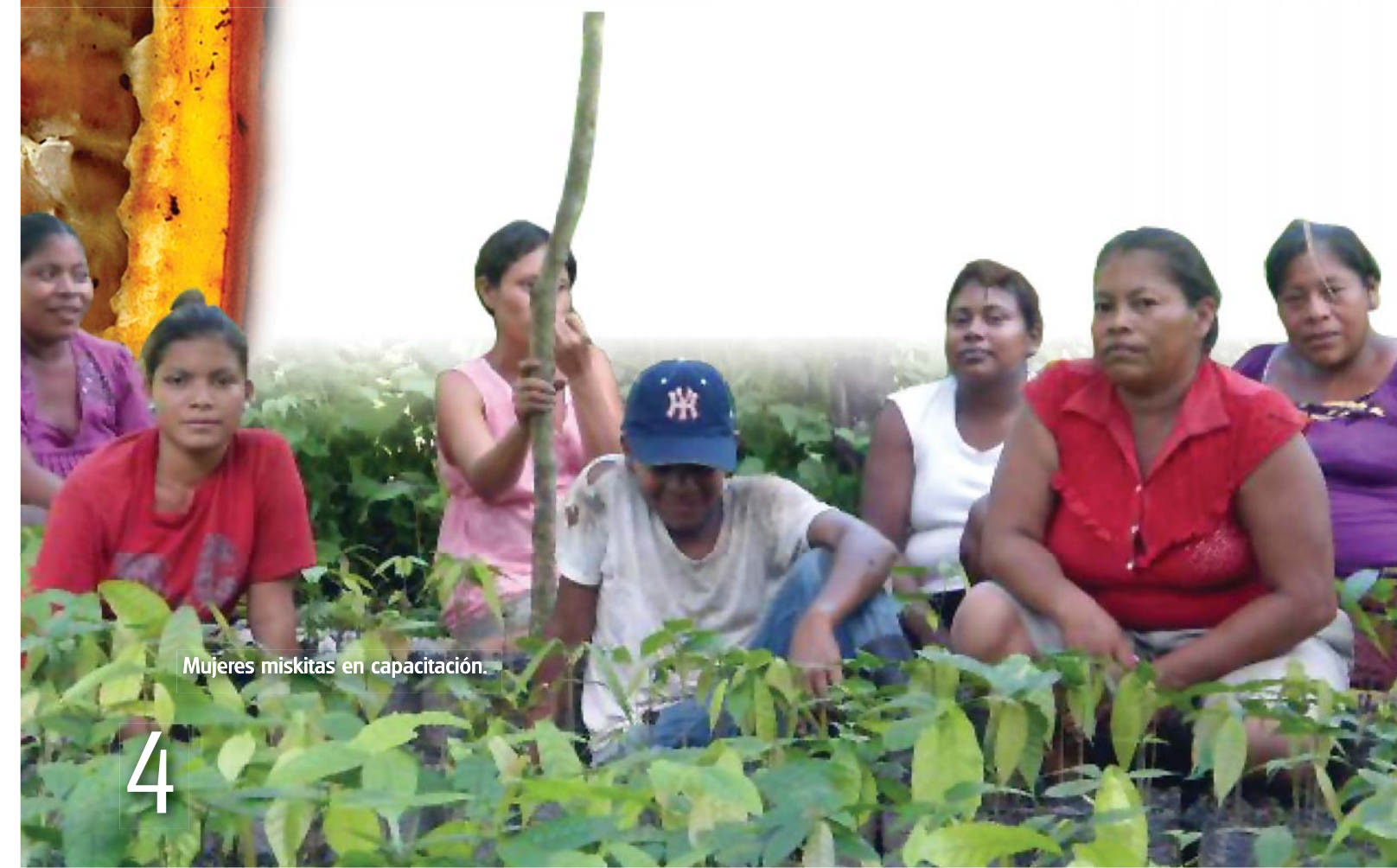
Mujeres miskitas en capacitación.

Makabi walanka dukiara: nahaba daukisa tawan uplika wal witanani dia lukisa kaka tawan sirpira ai warkka dauki pyuara i) sinska laka nani nitsa ai warkka dauki impahkaia kaka, ii) Mairin an waitna wal asla taki wark daukaia kan sutba ai raitka brisa an sipapiasa kumi baban asla takaia, iii) laki kaikaiasa diaura witanani nitsa hilp laka yabaia kakau wihki diara sat sat nani mangkaia dukiara, tawan uplikara sin makabi walanka daukisa nahki sipa pruyiktuba ai warkka yamni dauki brihwaia.