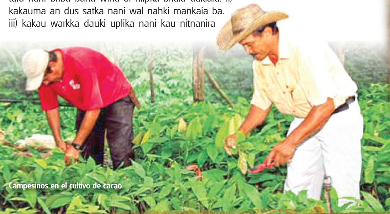
Campeños en el cultivo de cacao.

Naha pruyiktuka lalahka dukiara ulbi sakaia pyuara nitka yumpara bapankan: i) Tasba-ba nahki natkara yus munaia wark ta takra nani ai nitka tara nani briba baha wina ai hilpka briaia dukiara. ii) kakauma an dus satka nani wal nahki mankaia ba. iii) kakau warkka dauki uplika nani kau nitnanira