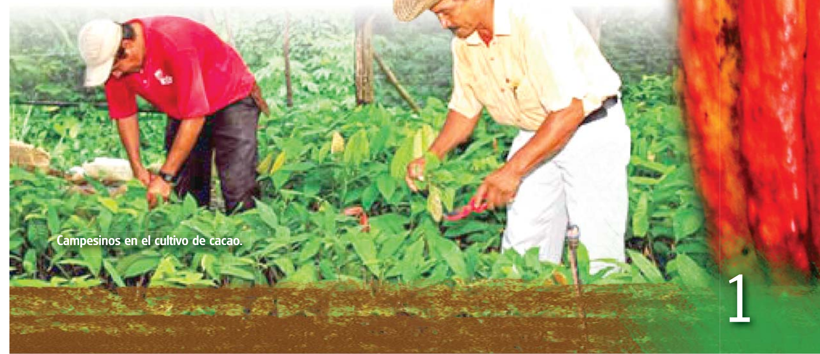
Campeños en el cultivo de cacao.

Kus pas akat kakau dahwi yakyakyang balna kidika tingnina sisitwi, kal uduhna balna kau adika mulukuku, Prinzapolka dawi el circuito minero ta balna yak, adika kal uduhna balna kidi rauki a dika Siuna sauni daklana pas yak, kaput bik Rosita dawi Bonanza balna yak bik, adika kal uduhna balna kuduk banimak sitwi, ACICAFOC, kal uduhna yakarak, kat acicakof kuduk kasak palni kulnin lani yamni kidi duani baraknin pisni yakat, kaput bik amput di balna laihwi talwi yamnin kidi wauhtaya kau ulwi yakna, kamanah bik