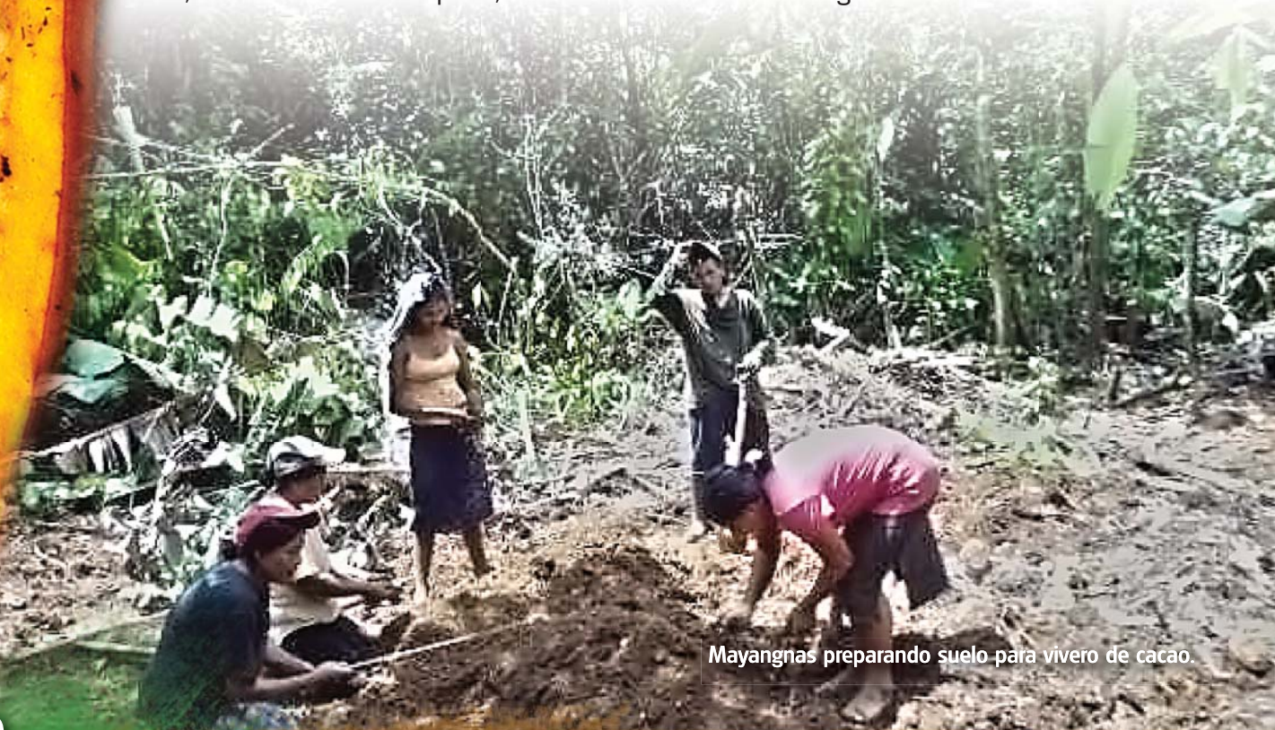
Mayangnas preparando suelo para vivero de cacao.