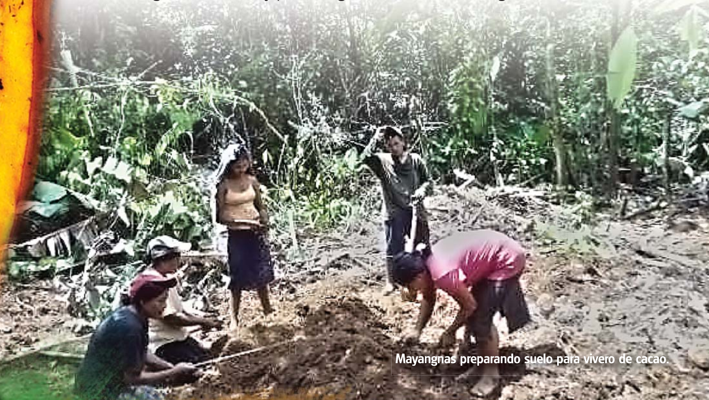
Mayangnas preparando suelo para vivero de cacao.

La interacción de los pueblos indígenas y sus recursos naturales ha sido la principal constante a lo largo de la historia y por consiguiente tiene diversos significados.