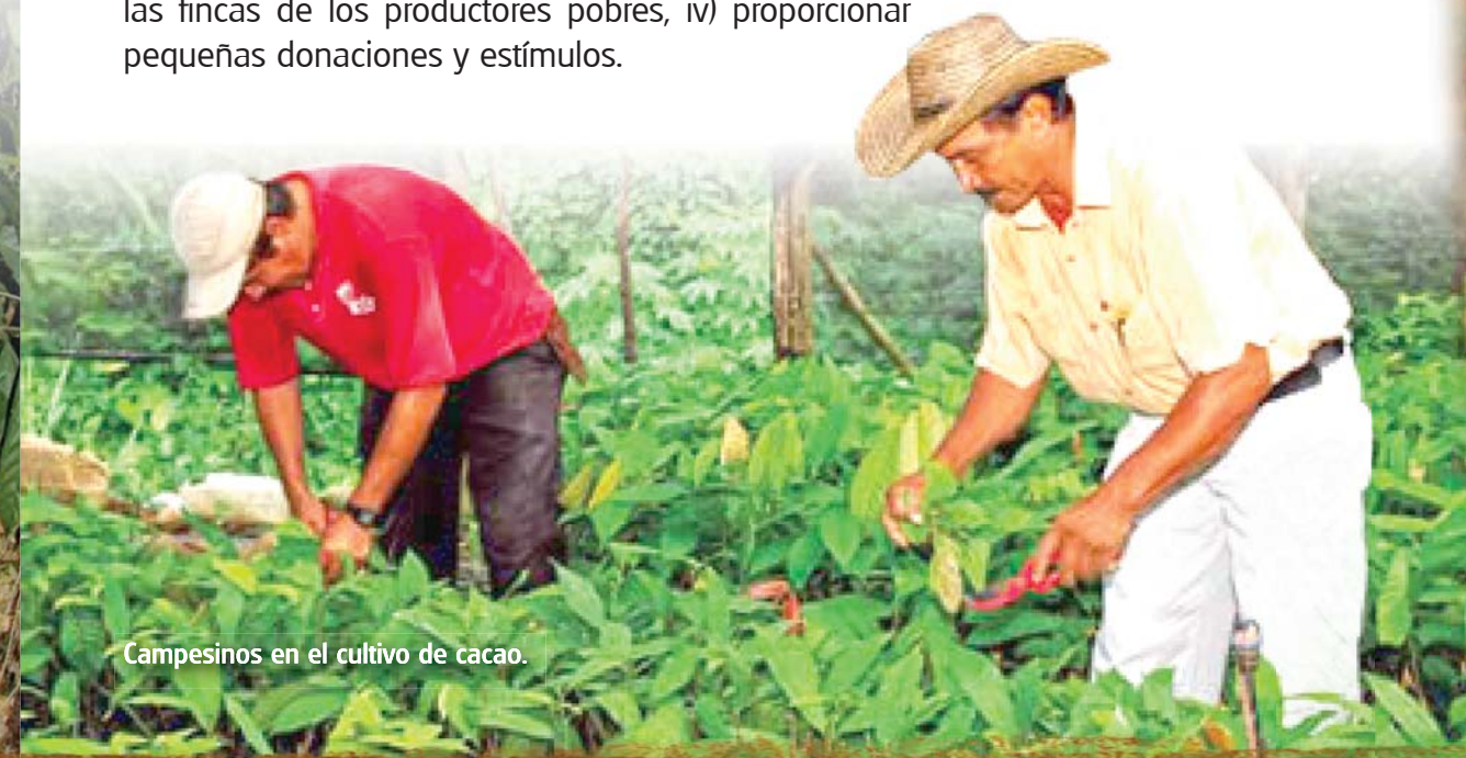
Campeños en el cultivo de cacao.

El fondo de inversión para el financiamiento de los sub-proyectos, se enmarca principalmente en el componente I del Proyecto, que tiene como objetivos: i) planificar el uso de la tierra en apoyo a los agricultores más pobres; ii) establecer y manejar los SAF de cacao en fincas; iii) aumentar la productividad del cacao en las fincas de los productores pobres, iv) proporcionar pequeñas donaciones y estímulos.